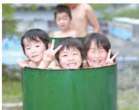
ドラム缶風呂 (7月~9月)