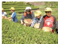
季節限定の茶摘み体験も。