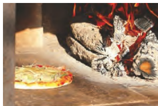
本格窯で焼くピザ焼き体験も!