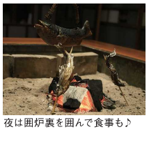
夜は囲炉裏を囲んで食事も♪