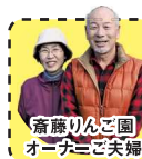
斎藤りんご園 オーナーご夫婦

りんごの産地大子町で農作業体験。収穫だけではなく、せん定や受粉、摘果などあらゆる“りんごの体験”が楽しめる。