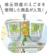
地元特産のえごまを使用した商品が人気!!

鮎の舞う清流久慈川のすぐそばにある道の駅。さわやかな川の風と緑に包まれながら、手ぶらでパーベキューや農園で収穫体験もできるので、何時間でも楽しめそう。