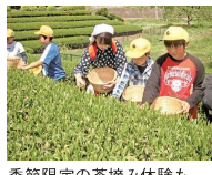
季節限定の茶摘み体験も。